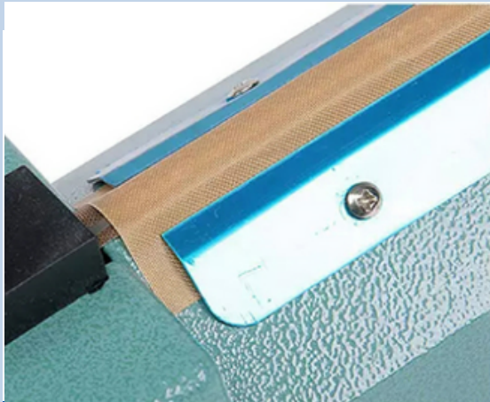
Paño de alta temperatura