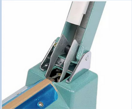
Conjunto de resorte