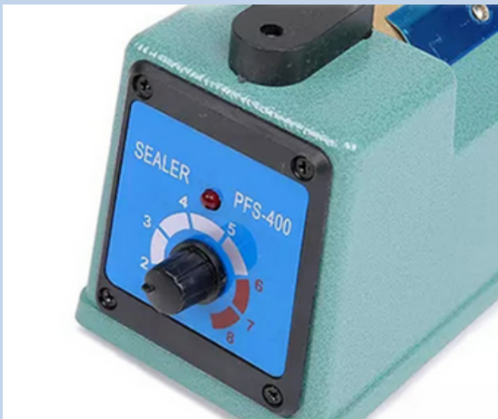
Interruptor regulador de calefacción