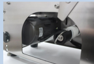
Motor de alta calidad

Control inteligente, seguimiento fotoeléctrico automático, alta precisión de etiquetado.