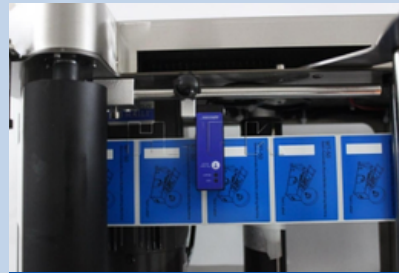
Sensor de etiquetas

Control inteligente, seguimiento fotoeléctrico automático, alta precisión de etiquetado.