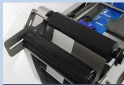
Rodillo de etiquetado

Se puede ajustar según el diámetro de la botella. La barra de posicionamiento puede ajustar la posición de la etiqueta en la botella.